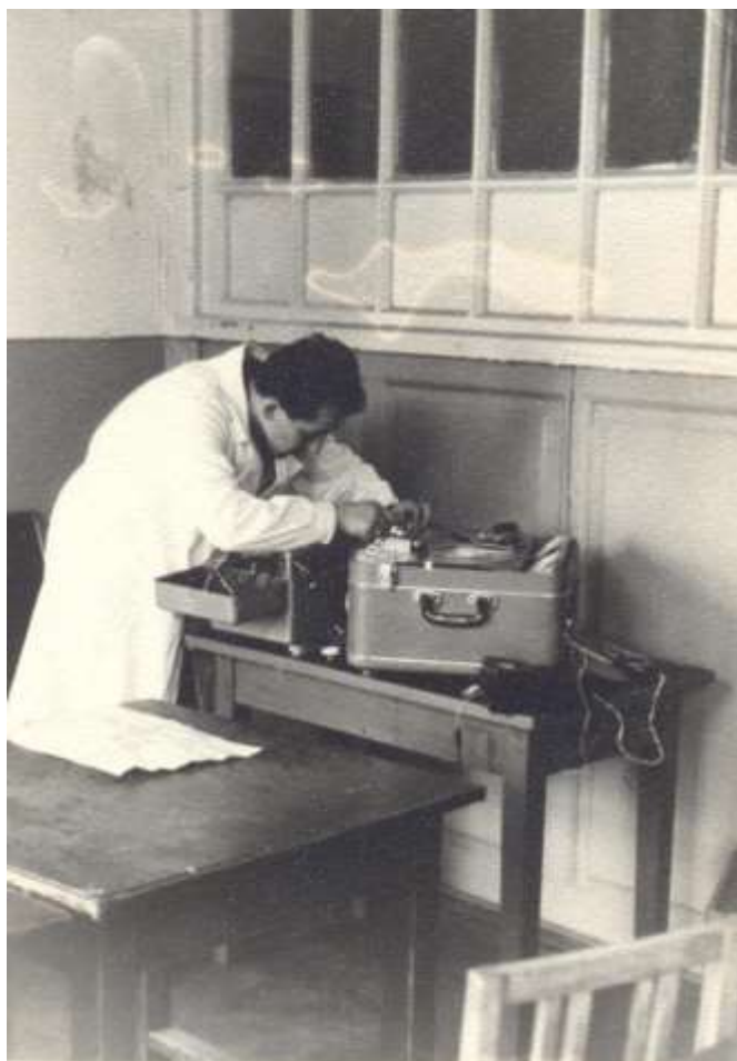
Профилактический ремонт магнитофона «Яуза», используемого на практическом занятии по теме «Промышленный шум», 1969 г.