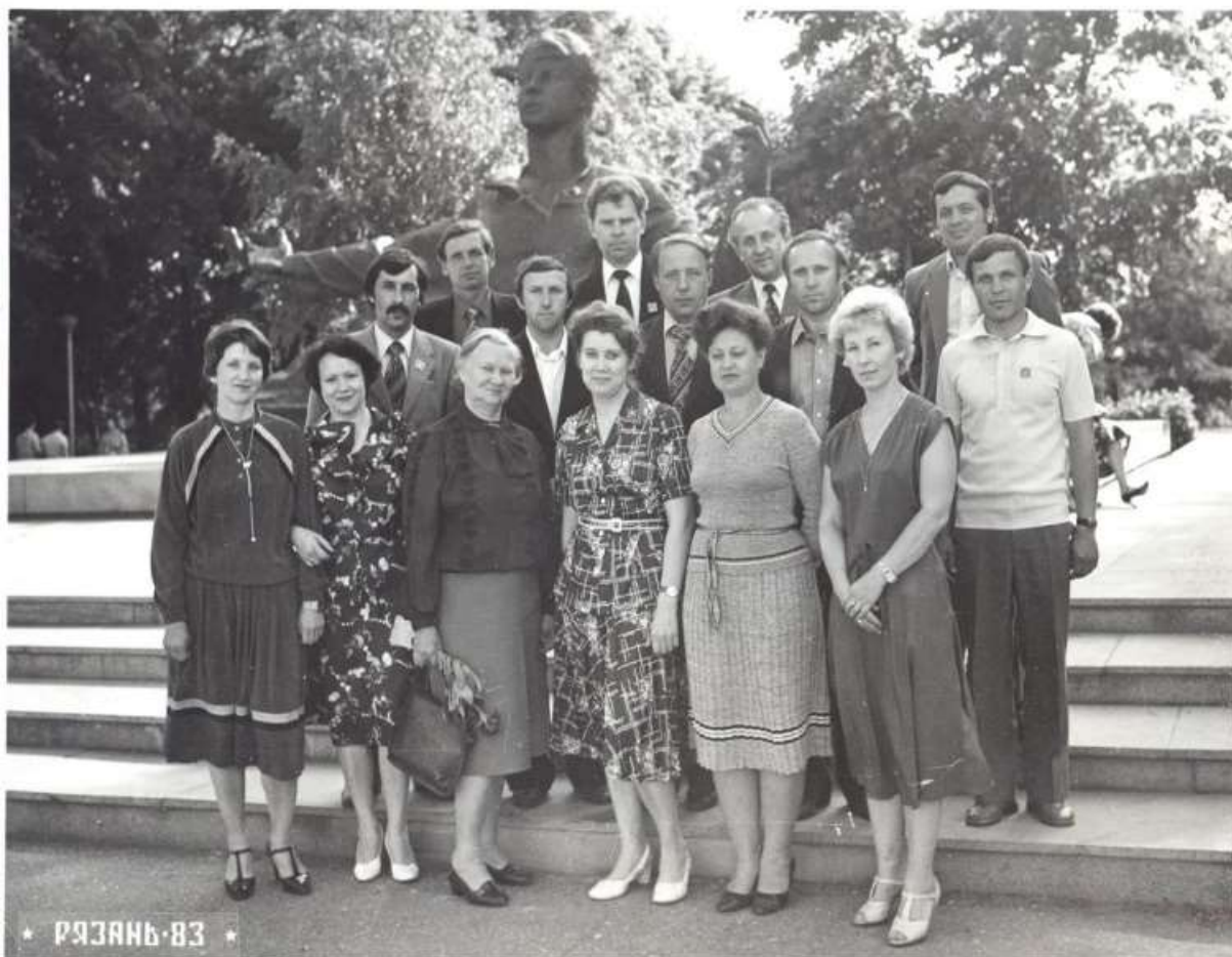
На юбилейной встрече с выпускниками санитарно-гигиенического факультета (1983 г.)